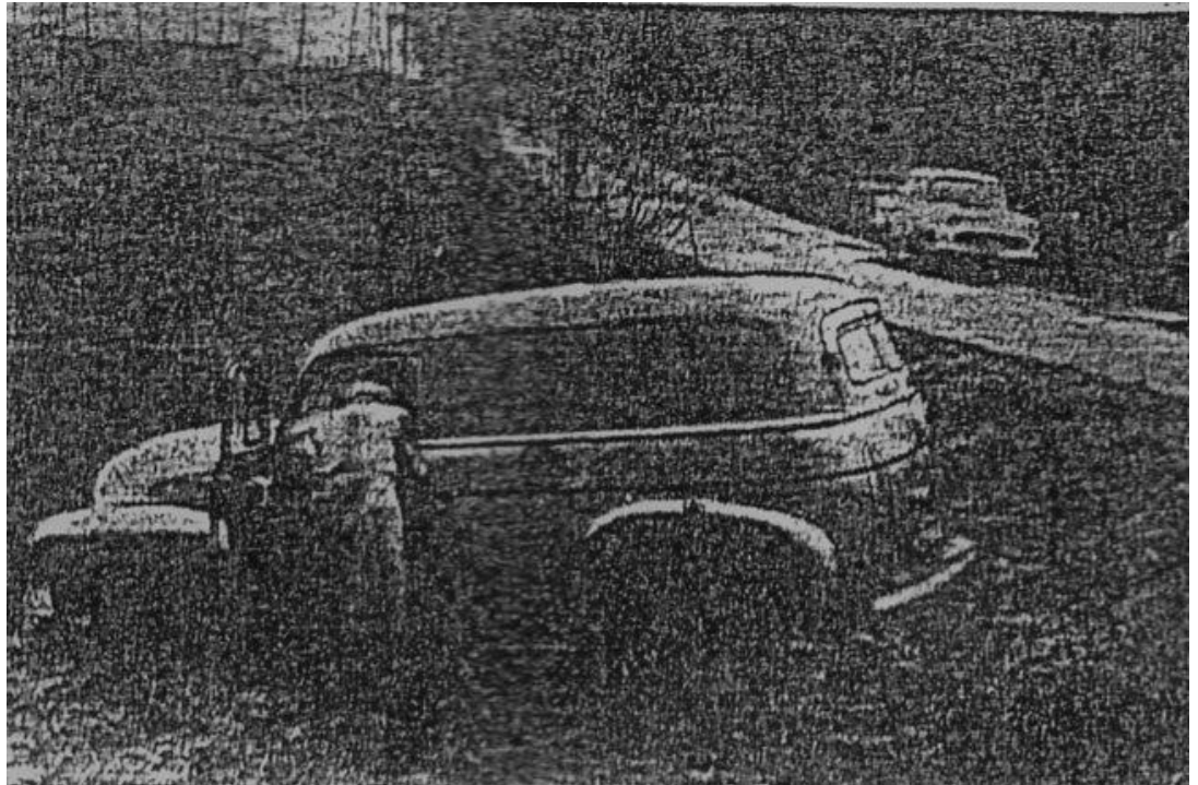
Postbilen fundet i morgenmørket