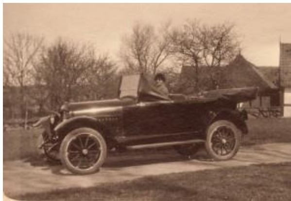
Grant årgang 1918.