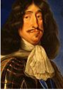
Frederik d. III