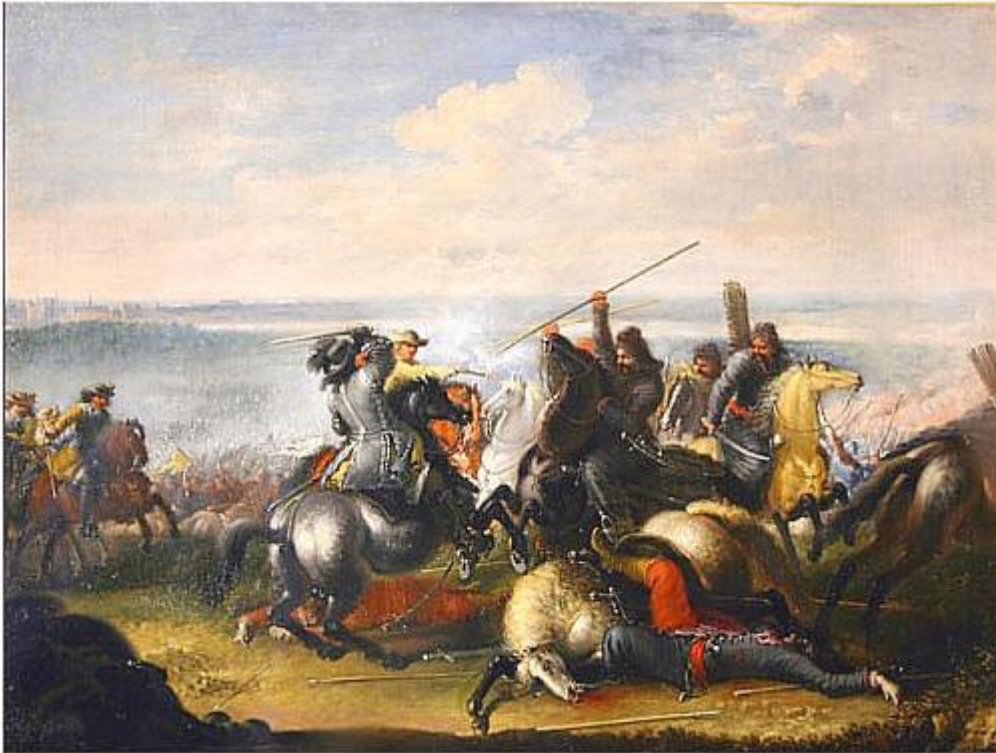
Kamp mellem polske tatarer og Karl Gustav nær Warszawa 1656.

At polakkerne har huseret i Øster Starup er der ingen tvivl om. De havde i lang tid hovedkvarter ved Lilballe, hvorfra omegnen blev hjem søgt ned plyndring og brand. I en indberetning fra 1660 siges om Elbo og Brusk herred: " Alle bygninger uden undtagelse var af fjenden og krigsfolket ganske afbrændt, ruineret og ødelagt, så der ikke findes nogen bygning hverken på landet, gårde, boel eller huse; men de var alle øde, i Brusk herred var en del huse og gårde afbrændt og nedrevet, de levende ruinerede og ganske forarmede."