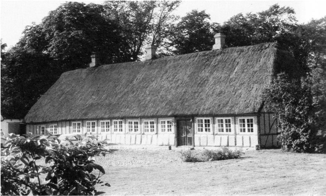
Ødegårds fredede stuehus i Øster Starup. Det kan meget vel være den ødegård som flere gange omtales i Brusk herreds tingbog efter krigen.