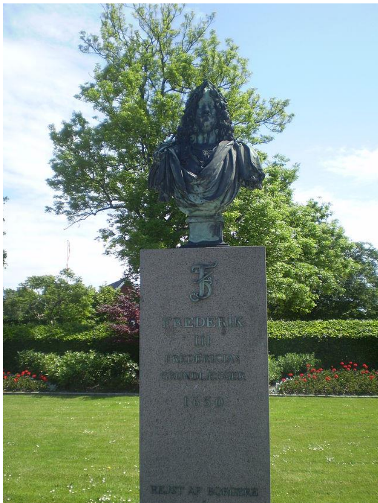
Buste af Frederik d. III i Fredericia

Der mangler kun, at der bliver rejst et minde for almuen og bønder i Koldinghus Len, for som Leo Tolstoy siger: "Et lands sande adel er dets bønder."