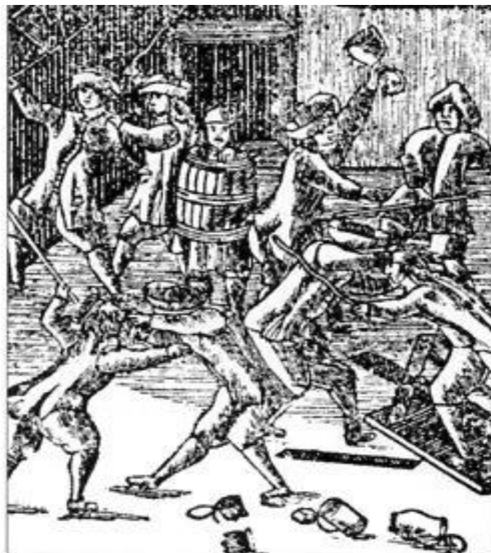
Solidt slagsmål, om det var et bondebryllup, det vides ikke.